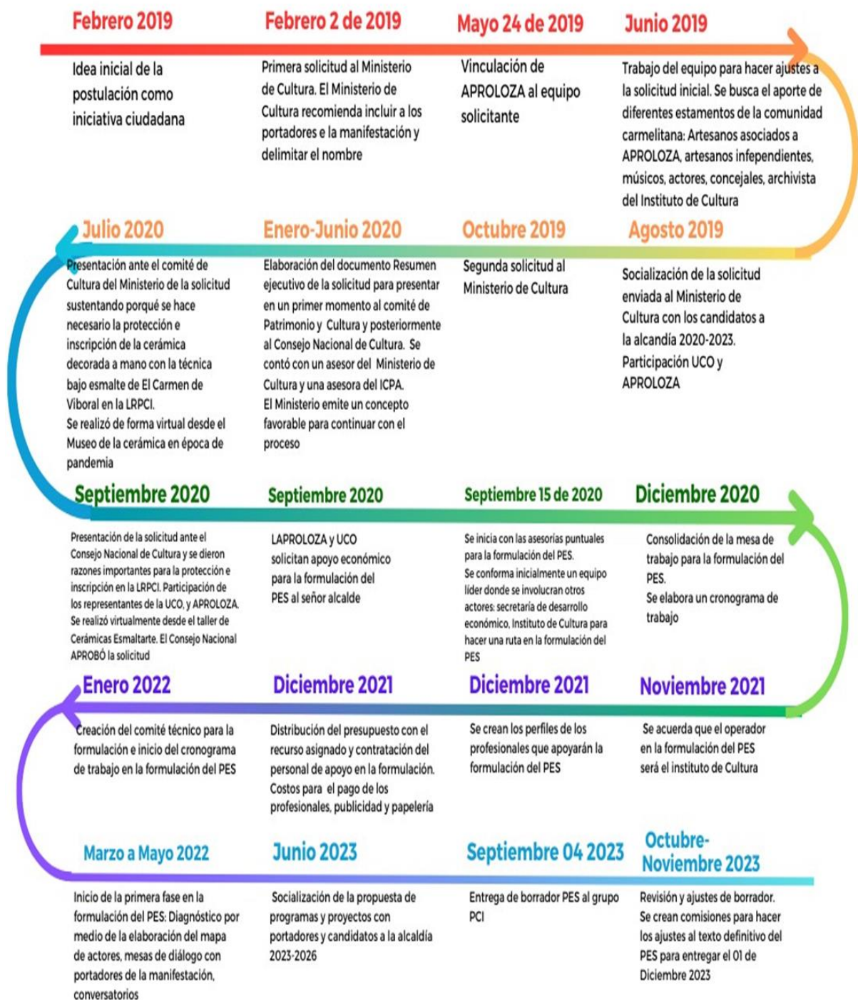
Linea del tiempo del proceso de formulación del Plan Especial de Salvaguardia de la Cerámica