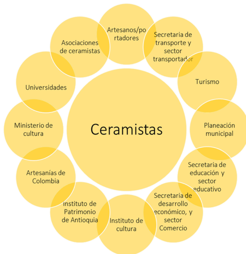
Mapa de actores, comunidad relacionada con la manifestación de la cultura ceramista de El Carmen de Viboral

Por otro lado, la Corporación de Ceramistas de El Carmen de Viboral (CERACORP) tiene como finalidad “la promoción de las artesanías de cerámica terrígena originaria del municipio y sujeta a su tradición cultural y estética acorde con la evolución de los tiempos”. La Corporación busca la promoción personal, social, económica, cultural de los ceramistas artesanos productores, para propender al mejoramiento de su nivel y calidad de vida, familiar y social”. Para alcanzar estos fines desarrollan programas y cursos de educación artística, cultural y técnica, talleres, seminarios, foros y similares dirigidos al fomento, mejoramiento y difusión de las artesanías y la cultura de El Carmen de Viboral (Certificado de existencia y representación legal, CERACORP 2022).