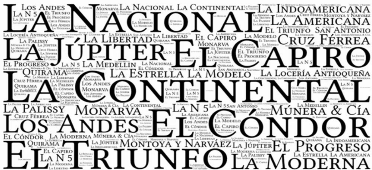
Nombres de algunas de las Fábricas de Cerámica que han existido en el devenir de El Carmen de Viboral

Las primeras décadas del siglo XX son el punto de consolidación fabril de la cerámica, un crecimiento que aumentó paulatinamente entre las décadas de 1930 y se sostuvo hasta la década de 1960. La primera mitad de este siglo está marcada por la solución de las necesidades de los talleres con el empleo de materias primas locales, ya fuera que explotaran sus propias minas o celebraran contratos con trabajadores independientes que cumplieran la función de proveer a los talleres. Por otro lado, a pesar de su acogida en el mercado nacional (pues se vendían tantas piezas como se producían) comparadas con las opciones de hoy, puede decirse que la cerámica carmelitana respondía a su uso funcional y distaba de las tendencias de moda y diseño posicionadas en el mercado en nuestros días, sin embargo, ya contaba con las características generales que han marcado su desarrollo contemporáneo.